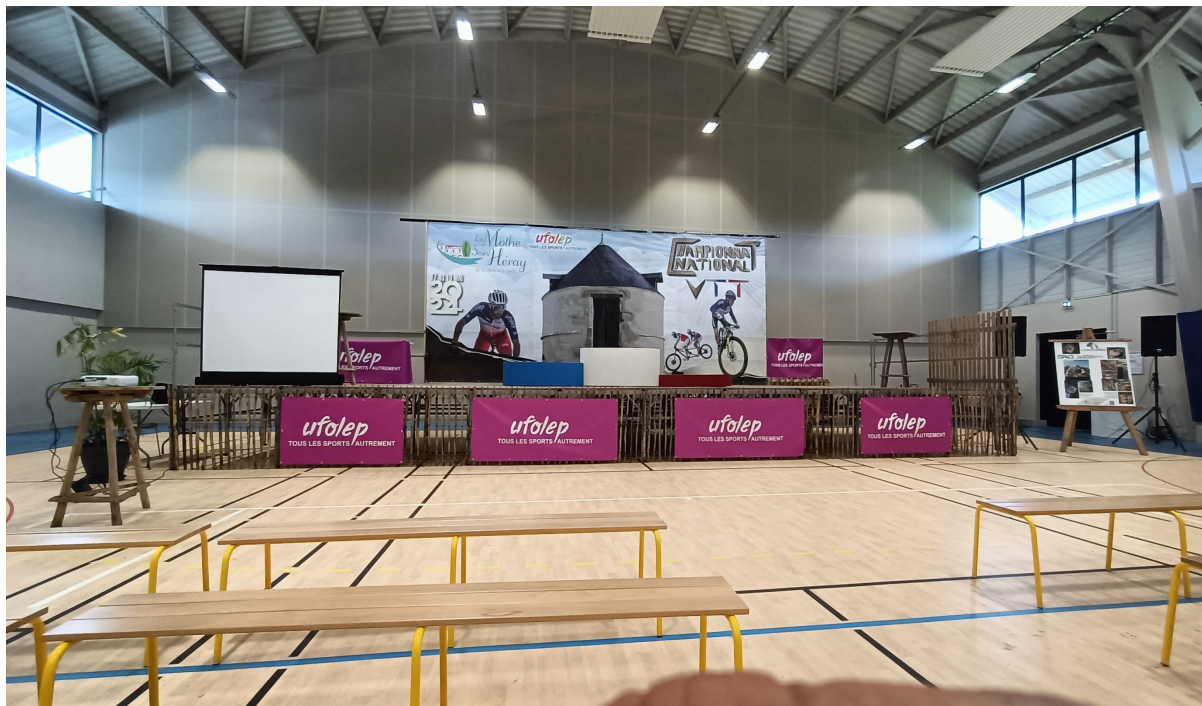
Photo du podium protocolaire au Championnat National UFOLEP VTT 2024 :